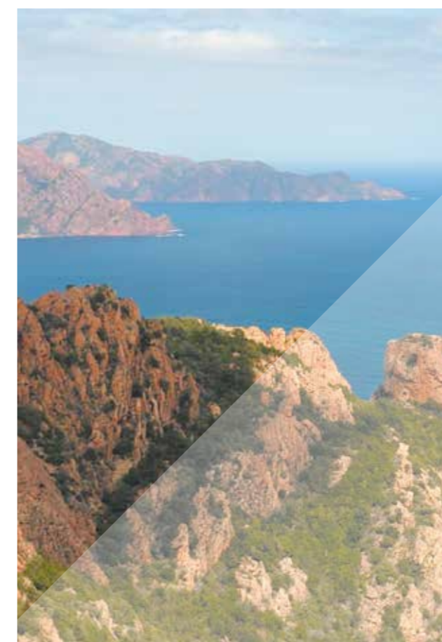
Les Calanches (Corse)

reseau.conservateur.fr/nord-pas-de-calais/