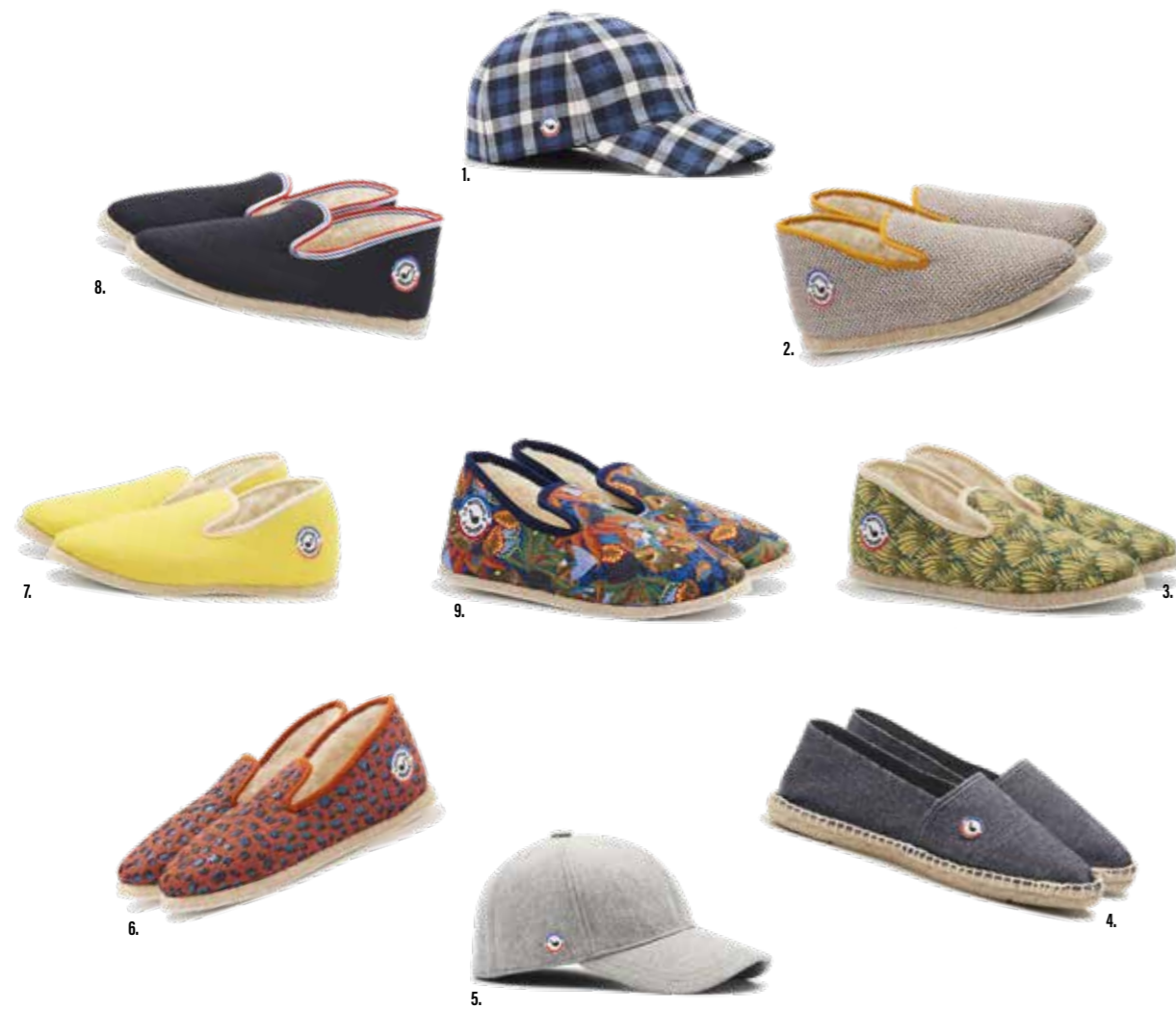
1. Casquette Bûcheron. 79€ 2. Pépère des dunes. 60€ 3. Banana Pépère. 60€ 4. Espadrilles en jean. 29€ 5. Casquette Mistigri. 79€ 6. Pépette Tigresse. 60€ 7. Sunny Pépère. 60€ 8. French Pépère. 60€ 9. Ptit Pépère Flower. 45€

LA PANTOUFLE À PÉPÈRE, 27 Rue Colbert, Hem - Tél. +33 (0)3 59 82 15 15 - www.lapantoufleapepere.fr 📍 📱 lapantoufleapepere