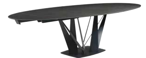
ALLIAGE table de repas - design Andrea Casati - L.200 x H.75 x P/D.100 cm. Un piétement fait de huit lames d'acier qui jaillissent du sol, et 17 inspirations différentes pour la céramique du plateau ovale, rond ou rectangle... Existe aussi en ovale fixe et en rectangulaire.