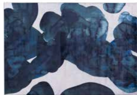
AQUARELLE tapis design Chloé Levesque L.200 x P/D.300 cm