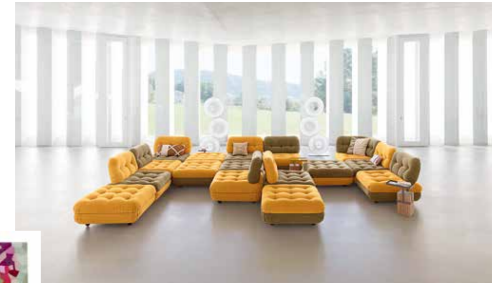
DOMINO - design Sacha Ladic - L.92 x H.77 x P/D.92 cm Domino est le petit-fils du Lounge, dessiné en 1971 et précurseur du Mah Jong de la grande famille - tellement Roche Bobois - du canapé modulable. De faux airs seventies, une once de gourmandise avec ses rondeurs de bonbon et son capitonnage profond, un moelleux envoûtant, et toujours la faculté de l'organiser comme bon vous semble.

Une tendance qui fait fureur avec ses angles escamotés, une forme intermédiaire entre le carré et le cercle, idéale pour adoucir la géométrie d'un monde anguleux.