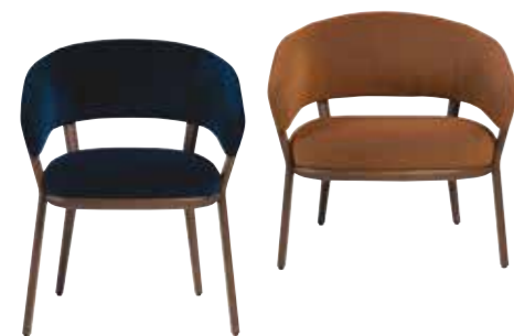
RAY design Stephen Burks L.60 x H.80 x P/D.59 cm