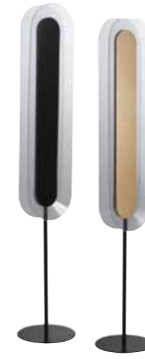
DORIENNE lampadaire design Martino Sasso L.30 x H.165 x P/D.30 cm