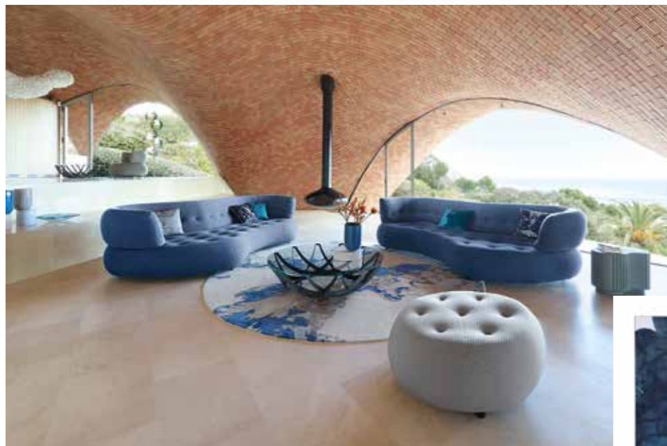
SENSE composition - design Studio Roche Bobois - L.381/190 x H.78 x P/D.95/144 cm

Exit le noir et les angles droits, loin de son esthétique habituelle, le style industriel s'empare des courbes, d'un peu de douceur et de tendres couleurs sans déroger à sa nature première, la modernité.