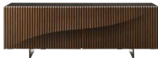
SPEED UP - design Sacha Ladic - L.220 x H.76 x P/D.52 cm

Une version bois de l'icône buffet Speed Up dessiné par Sacha Ladic en 2005. Cette fois, la vague qui impulse sa façade est exprimée par une série de 64 lames de chêne massif, toutes avec un profil différent et assemblées manuellement sur un corpus noir. Un rythme en 3 dimensions.