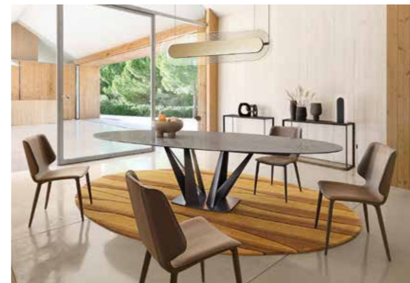
ALLIAGE table de repas - design Andrea Casati - L.200 x H.75 x P/D.100 cm. Un piétement fait de huit lames d'acier qui jaillissent du sol, et 17 inspirations différentes pour la céramique du plateau ovale, rond ou rectangle... Existe aussi en ovale fixe et en rectangulaire.

Angles droits, lignes brisées, tôle noire, un trio réminiscent des années 80 friandes de ces caractères. Des pièces radicales et incisives qui expriment un dynamisme tellurique.