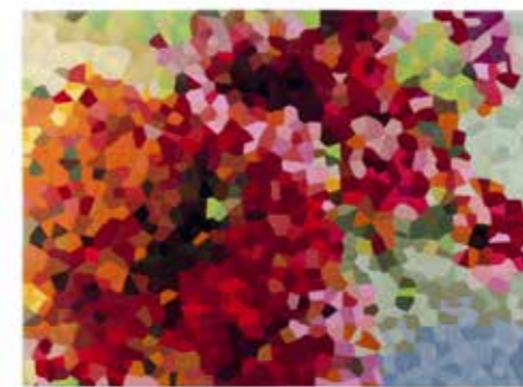
SPRING tapis - design Christian Ghion PM/L.200 x P/D.300 cm - G/L.250 x P/D.350 cm