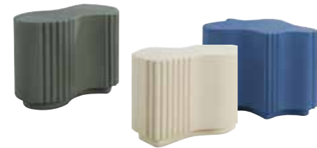
DEFORMA design Linde Derickx Selle / L.58 x H.55 x P/D.38 cm - Bout de canapé 1/ L.56 x H.40 x P/D.39 cm - Bout de canapé 2/ L.65 x H.48 x P/D.44 cm