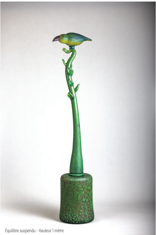
Équilibre suspendu - Hauteur 1 mètre